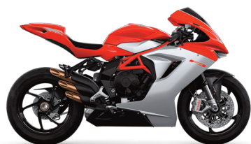
Rosso Ago/Argento Ago