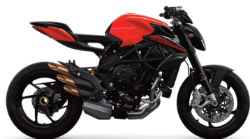
ROSSO AGO/NERO CARBON METALLIZZATO